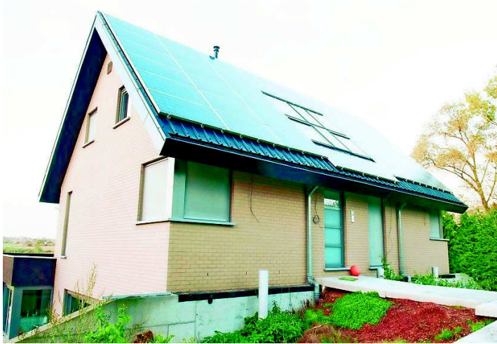
De stroombron: zonnepanelen op het dak.